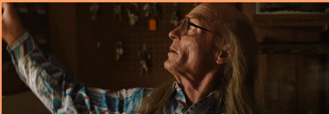
Captura de pantalla del tráiler oficial

La directora de esta cinta es la británica Rose Glass que junto con Weronika Tofilka son las autoras del guion. En esa pequeña comunidad, el padre de Lou controla un campamento de tiro al blanco que es una atracción turística. El gym es manejado por Lou y su tóxico padre que tiene un comportamiento deleznable. El típico votante republicano de Trump que desea que América vuelva a ser 'great'. Aunque ya sabemos: no hay a quien irle.