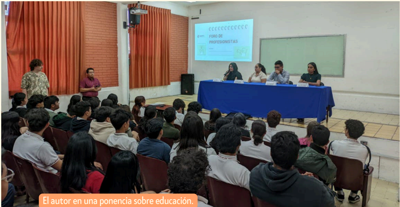
El autor en una ponencia sobre educación.

Pero, sobre todo, ser maestro es un acto de amor.